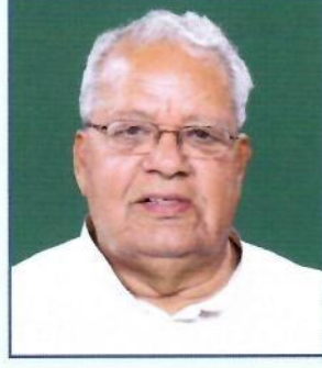
श्री कलराज मिश्र