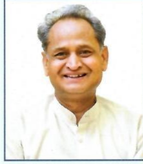
श्री अशोक गहलोत